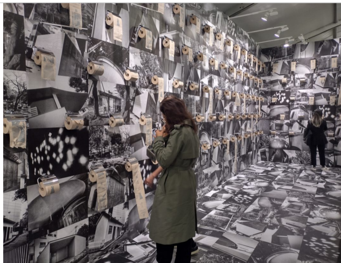
Paris Photo.

Paris Photo, la fiera leader mondiale dedicata alla fotografia vintage, moderna e contemporanea, apre la sua 26esima edizione con 191 partecipanti tra gallerie e case editrici provenienti da 25 Paesi, con oltre 800 artisti, il 68% di gallerie estere e il 32% di gallerie francesi in scena al Grand Palais Éphémère fino al 12 novembre.