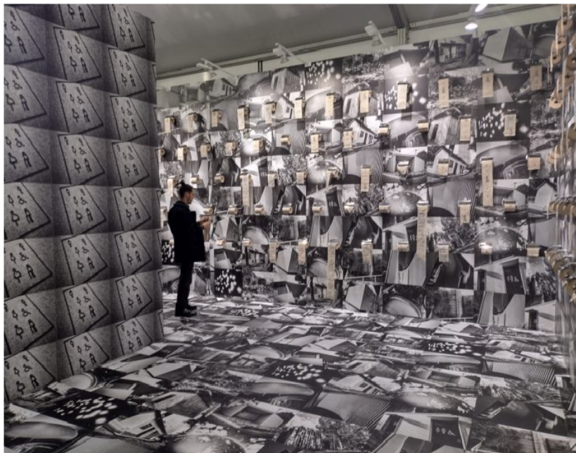
Paris Photo.

I fil rouge sono tanti, troviamo quello della fotografia sperimentale presso la Parrotta Contemporary che presenta Timm Rautert o presso la Die Mauer di Prato con diversi lavori di Gianfranco Chiavacci (1936-2011), che vanno dai 6mila a 15mila euro. Presente come non mai, i lavori del mitico Daido Moriyama che ci sorprende con la serie From 71NY presso la Daniel Blau, che comprende 22 lavori basati su fotografie scattate a New York City nel 1971. L'artista aggiunge un'incomparabile atmosfera utilizzando il suo concetto di are, bure, bokeh (ossia "granuloso, sfocato e sfocato") per restituire in ogni tela due esposizioni consecutive in un unico negativo intangibile e fugace. I prezzi vanno da € 42,000 a € 140,000. Ma non solo. Tanto per stuzzicare ancor più la curiosità dei visitatori, l'artista giapponese presenta The Tokyo Toilet . Accolta nello stand progettato da SKWAT e con la direzione artistica di Satoshi Machiguchi , l'installazione, a dir poco sorprendente, è composta per lo più da rotoli di carta igienica sui quali sono stampate delle fotografie di Daido Moriyama. Incredibile ma vero, il pubblico può strappare qualche centimetro di carta senza pagare.