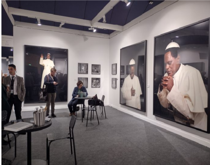
Paris Photo.

(Brescia) con il solo show di Nancy Burson . Il tour è intercalato da proposte originali, come quella della Christian Berst Art Brut che accoglie Le mie ragazze della TV , un solo show di Tom Wilkins con 101 tavole di 9 polaroid ciascuna, accuratamente classificate tra il 1978 e il 1982. Si tratta di inediti scoperti tra la miriade di oggetti di questo collezionista nella sua casa di Boston. Sono registrazioni televisive con didascalie che ritraggono donne nude, per lo più attrici colte in ambienti intimi. Ogni tavola costa 7mila euro.