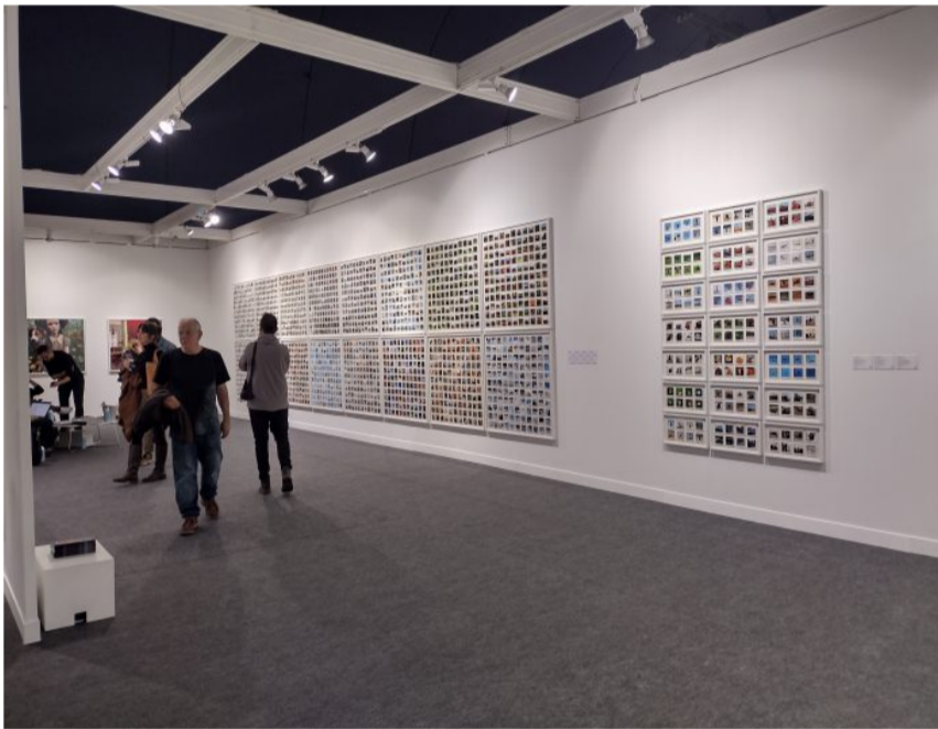
Paris Photo.