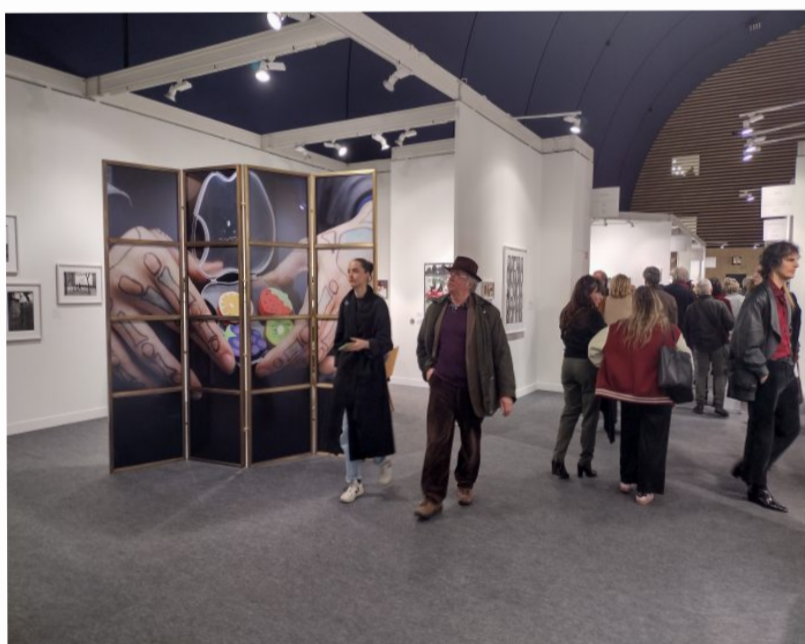
Paris Photo.