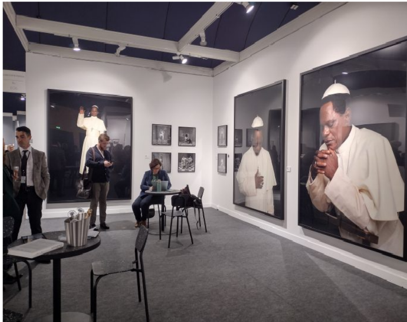
Paris Photo.

(Brescia) con il solo show di Nancy Burson . Il tour è intercalato da proposte originali, come quella della Christian Berst Art Brut che accoglie Le mie ragazze della TV , un solo show di Tom Wilkins con 101 tavole di 9 polaroid ciascuna, accuratamente classificate tra il 1978 e il 1982. Si tratta di inediti scoperti tra la miriade di oggetti di questo collezionista nella sua casa di Boston. Sono registrazioni televisive con didascalie che ritraggono donne nude, per lo più attrici colte in ambienti intimi. Ogni tavola costa 7mila euro.