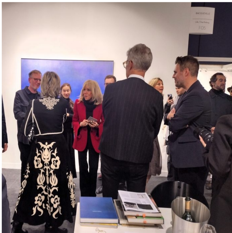
Brigitte Macron a Paris Photo 08.11.23