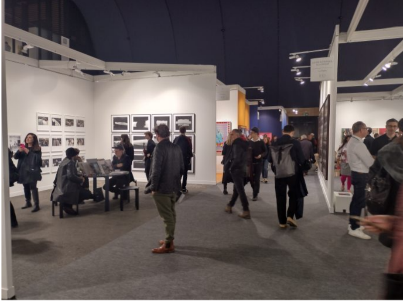
Paris Photo.